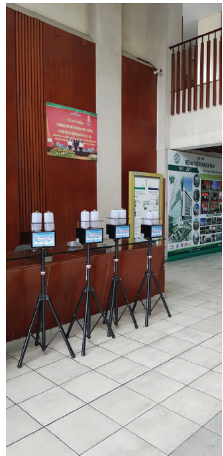
Bệnh viện Bạch Mai