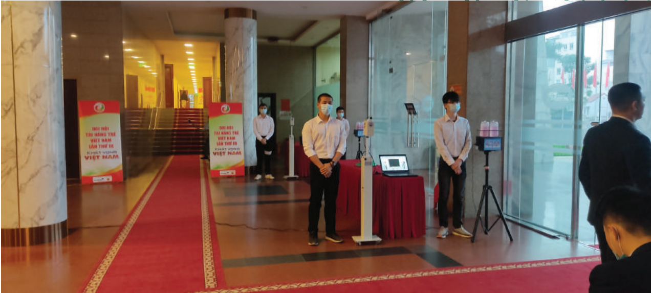
Hình ảnh Máy phun khử khuẩn tay tự động tại Đại hội tài năng trẻ Việt Nam lần thứ III